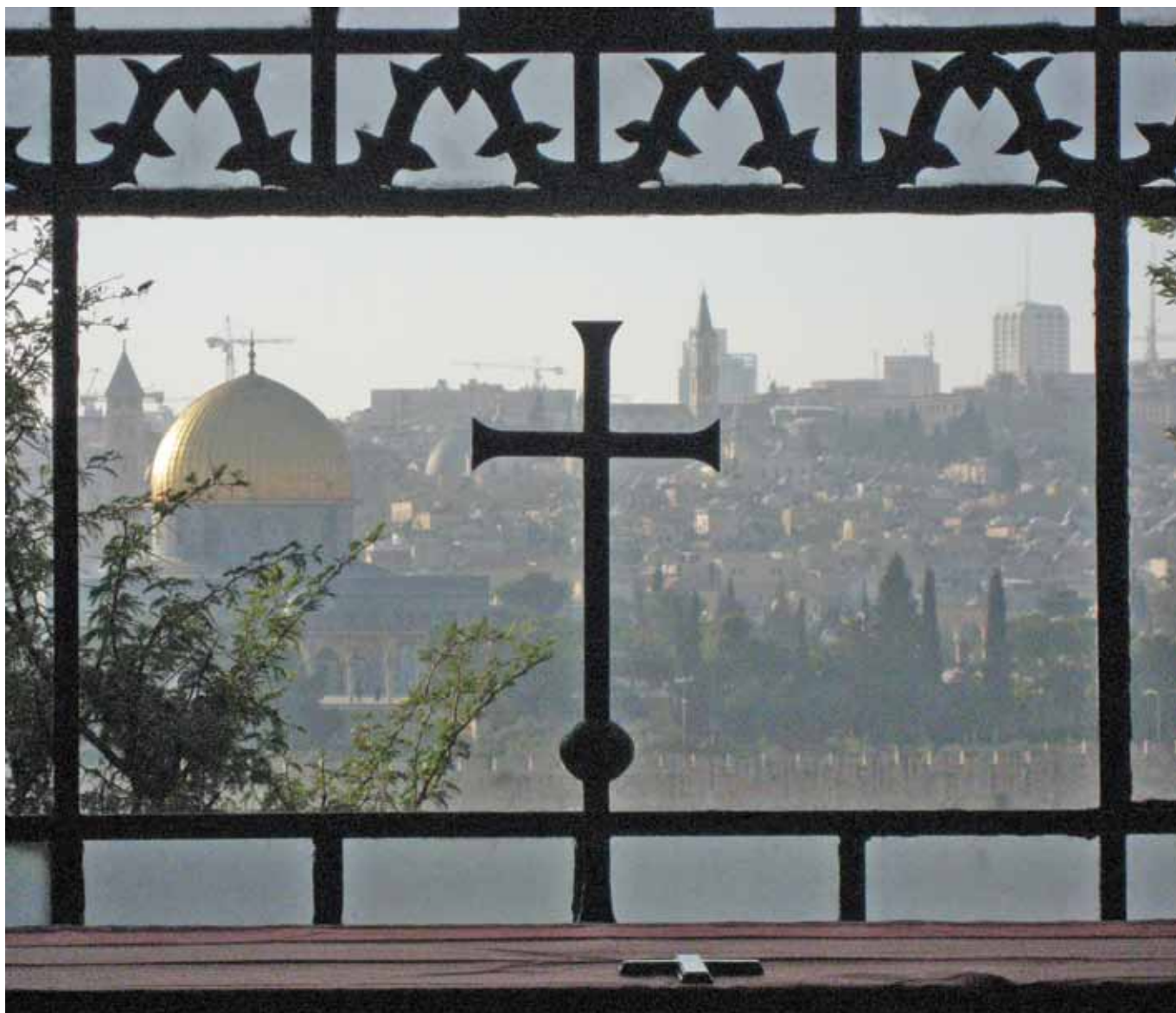
Jerusalem fra Tårekirken på Oljeberget