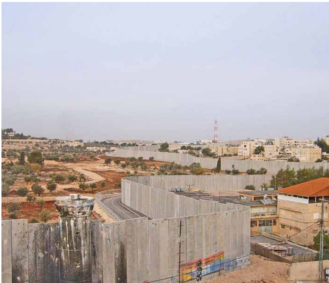
Muren ved Betlehem