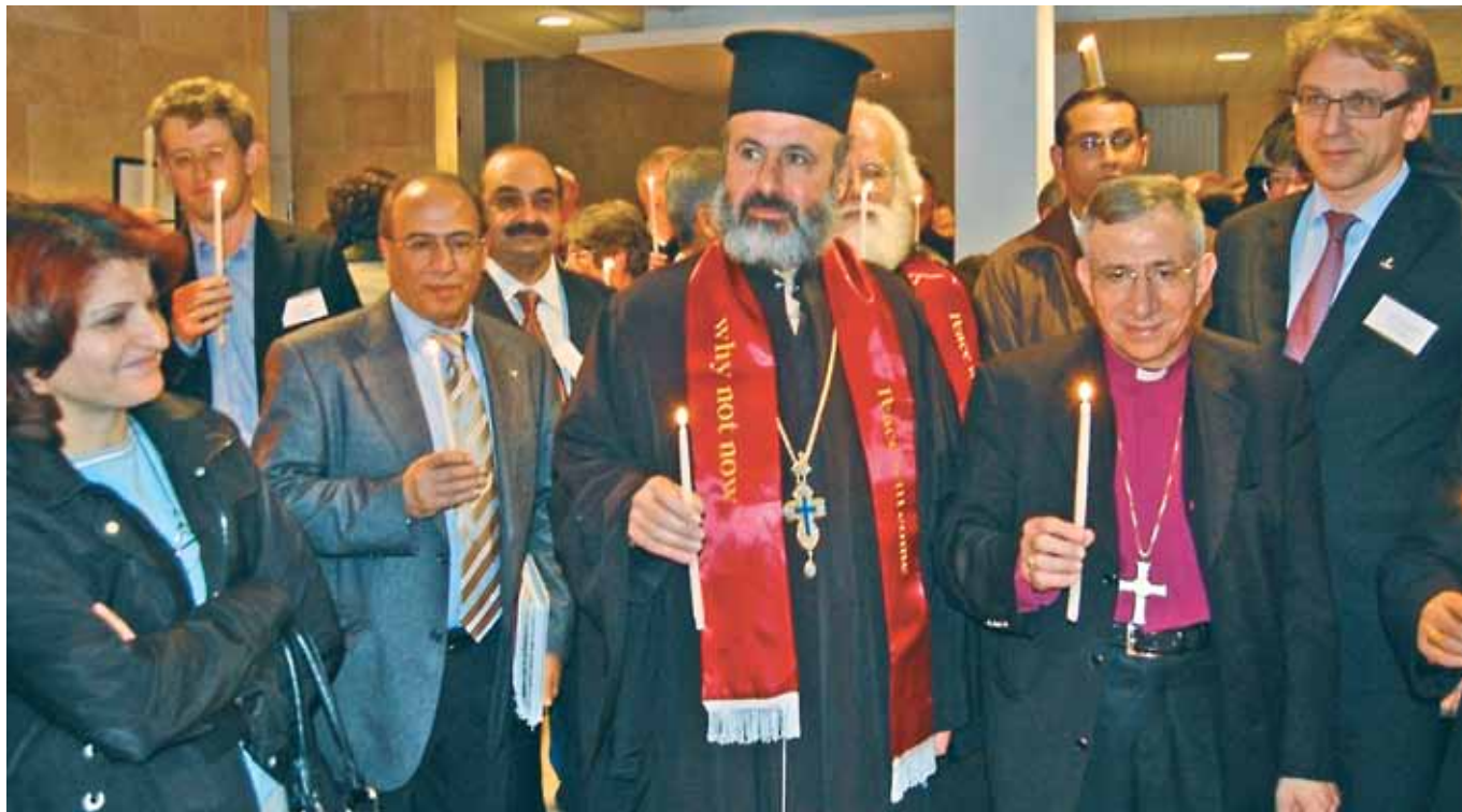
Lystening ved lanseringen av dokumentet Kairos Palestina 11. desember 2009